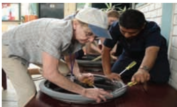
Actividad en el taller de San Juan de Lurigancho.

Ayuda en Acción, con motivo de la celebración del X Aniversario de este Torneo, organizará una exposición fotográfica entre los días 13 y 26 de octubre – fechas en las que se celebra el Torneo – con imágenes que recogen los proyectos financiados en ediciones anteriores. Hasta la fecha hemos recaudado un total de 327.935 €, cifra destinada a nueve proyectos que han permitido mejorar la calidad de vida de cientos de personas necesitadas en distintos lugares del mundo, como se podrá ver en esta exhibición. La exposición se llevará a cabo en el hall de los edificios Iberia Mart, espacio que recorren los participantes en el Torneo, ya que allí se ubica el Club de Pádel.