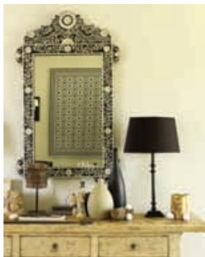
Detalle del apartamento piloto de Las Colinas.

Los decoradores somos como esponjas y absorbemos todo lo que nos rodea, desde una obra de arte contemporáneo o un edificio, hasta una colección prêt-à-porter o una película. Yo creo que tengo un componente bastante orgánico en casi todos mis proyectos. Pienso que nuestra misión es descubrir la belleza que reside en los objetos y trasladarla a los proyectos, sin olvidar la funcionalidad. Un buen proyecto consigue combinar función y estética en una simbiosis perfecta.