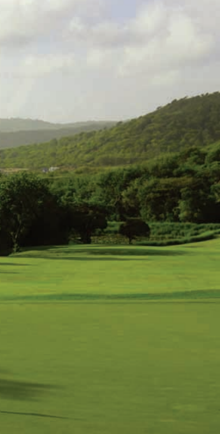
St. Lucía Golf Club en Cap State, St. Lucía, gestionado por Troon Golf.

El mantenimiento se basa en la máxima exigencia de calidad, con la metodología más avanzada, como los tipos de césped utilizados, que ofrecen una calidad elevadísima para el juego sólo utilizada en campos de primer nivel.