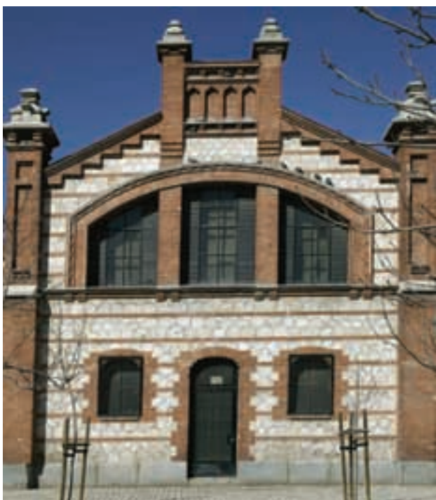
Exteriores del centro cultural Matadero de Madrid.

Además, se han organizado una treintena de exposiciones relacionadas con el mundo de la arquitectura y el desarrollo urbanístico en diferentes espacios museísticos, como la Casa Encendida, el Matadero de Madrid, el Museo de Artes Decorativas y el Centro Cultural Conde Duque, entre otros. En esta parte del programa participan también varias universidades – Pontificia de Salamanca, CEU San Pablo, Alfonso X El Sabio – con conferencias y seminarios que desarrollan y amplían la temática arquitectónica desde una perspectiva académica. Por último, casi una veintena de las principales galerías de arte madrileñas expondrán obras de artistas destacados bajo el lema Poéticamente Habita .