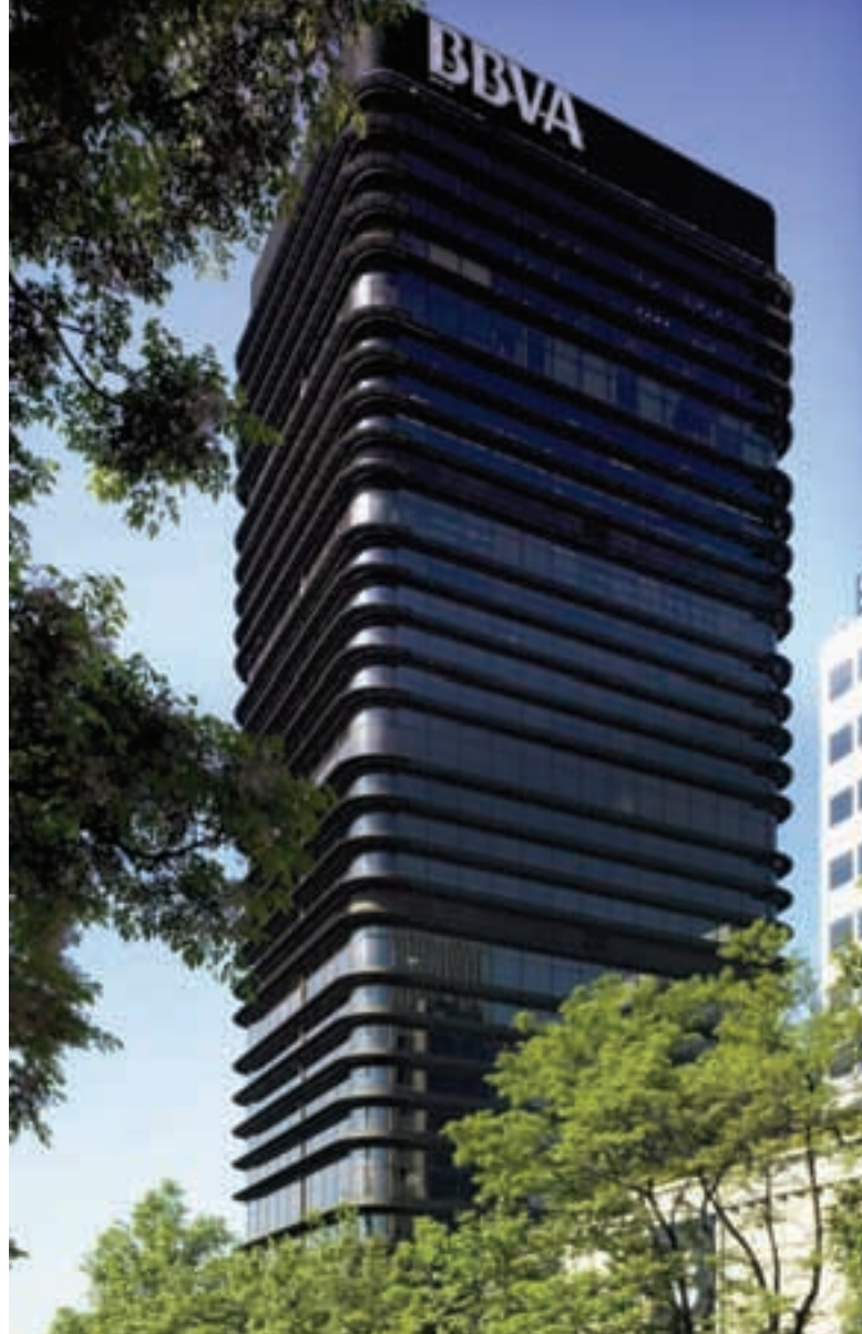
Torre Castellana 81.

Todos los clientes de Gmp que deseen visitar la Torre Castellana 81, pueden hacerlo de forma exclusiva, simplemente llamando al teléfono 91 444 28 00 o enviando un e-mail a clientes@grupogmp.com