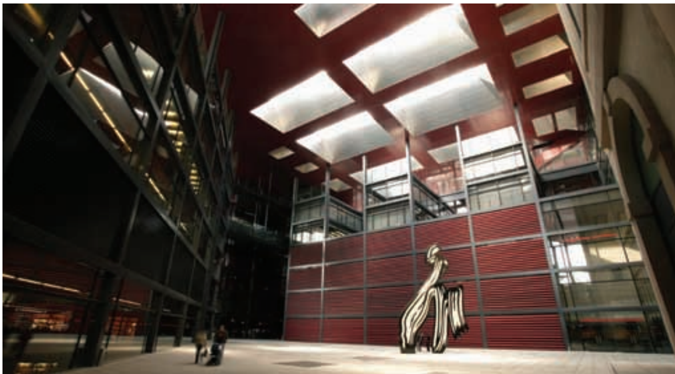
Ampliación del Museo de Arte Reina Sofía de Madrid.

Para acercar la arquitectura y el urbanismo a los ciudadanos, del 6 al 12 de octubre próximos, se celebra la Semana de la Arquitectura 2008, un acontecimiento único organizado por la Fundación COAM del Colegio de Arquitectos de Madrid. Como en ediciones anteriores, la región madrileña se convertirá en un escaparate arquitectónico de primer nivel con resonancia internacional.