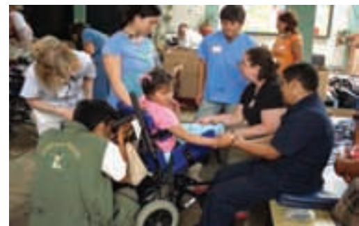
Una niña con discapacidad en el taller.

La cifra que se recaude este año con el X Torneo de Pádel Ayuda en Acción estará destinada a la formación profesional y la generación de empleo de personas con discapacidad que viven en San Juan de Lurigancho, un barrio de Lima (Perú).