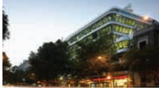
Edificio Génova 27.

La calle Génova es protagonista de la historia del crecimiento de Madrid desde que a mediados del siglo XIX surgen en su entorno las casas y barrios más elegantes de la ciudad, la sede de la Biblioteca Nacional y el Palacio de Justicia.