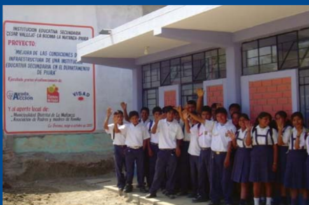
Escuelas construidas en Perú con los fondos recaudados en la VIII edición del Torneo de Pádel celebrado en octubre de 2006.