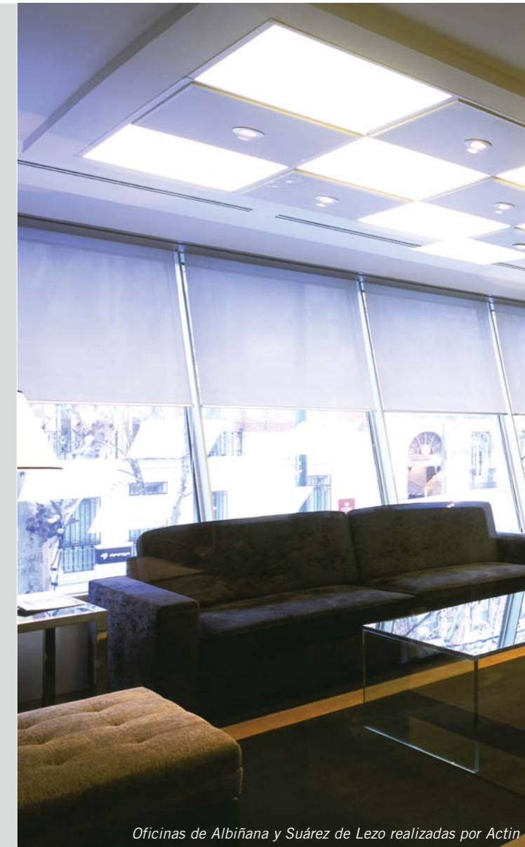
Oficinas de Albiñana y Suárez de Lezo realizadas por Actin

Gmp dispone de una empresa especializada en el diseño y ejecución de proyectos de implantación de espacios, Actin, que logra una comunión perfecta entre la imagen y la funcionalidad.