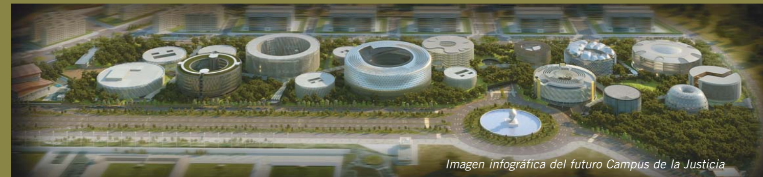
Imagen infográfica del futuro Campus de la Justicia

El proyecto ha sido cuidadosamente planificado para crear un espacio de calidad que incorpore criterios de desarrollo sostenible, fomente la flexibilidad y ofrezca excelentes conexiones y accesibilidad por medio del transporte público. El parque dispone de suelo residencial para la construcción de más de 12.000 viviendas y de 1,2