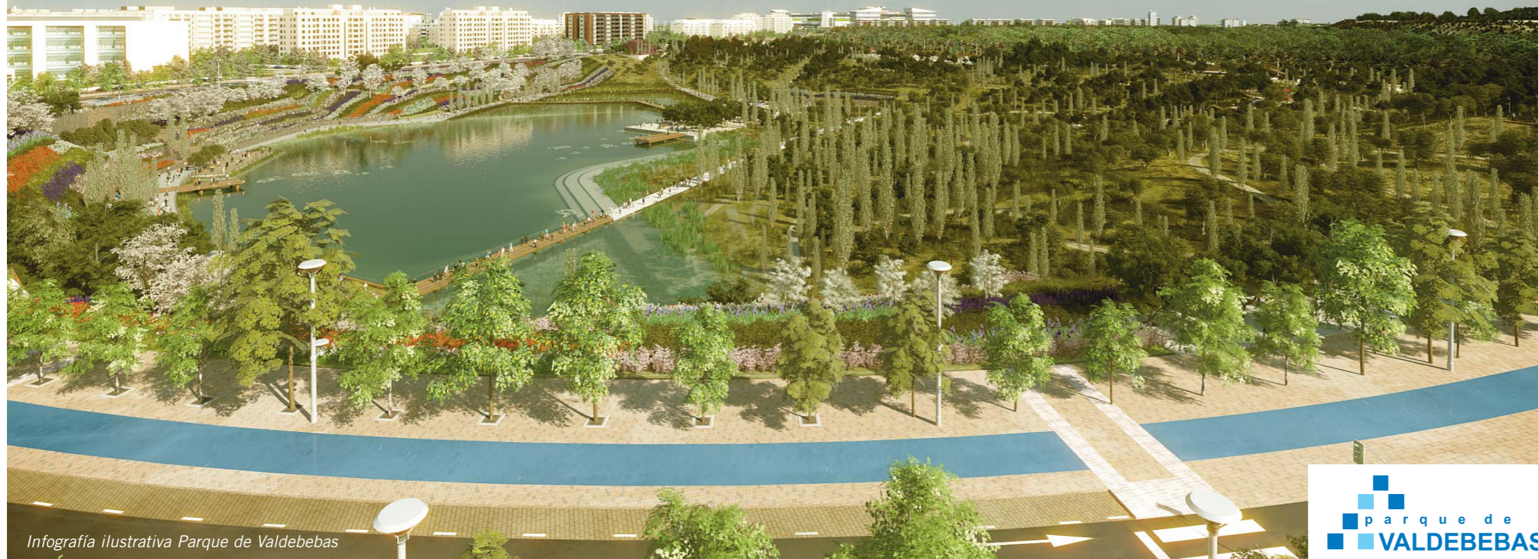
Infografía ilustrativa Parque de Valdebebas

Este proyecto ha recibido la Certificación de Gestión Medioambiental ISO 14001, concedido por AENOR, acreditando así que todas sus actividades se realizan de manera respetuosa con el medioambiente, siendo éste el primer desarrollo urbanístico que lo consigue.